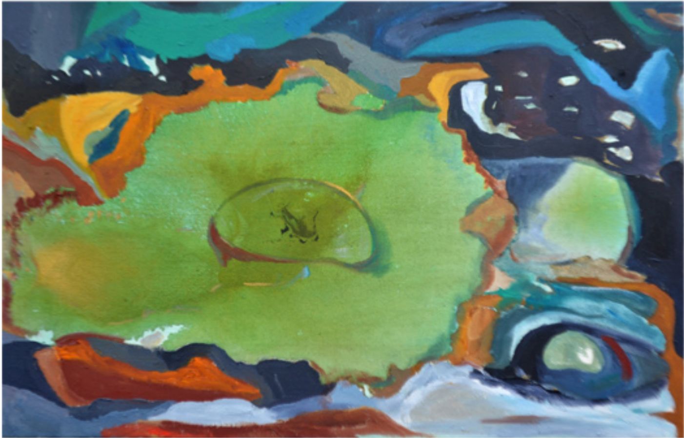
Aguajal Oleo sobre lienzo 64 x 41 cm