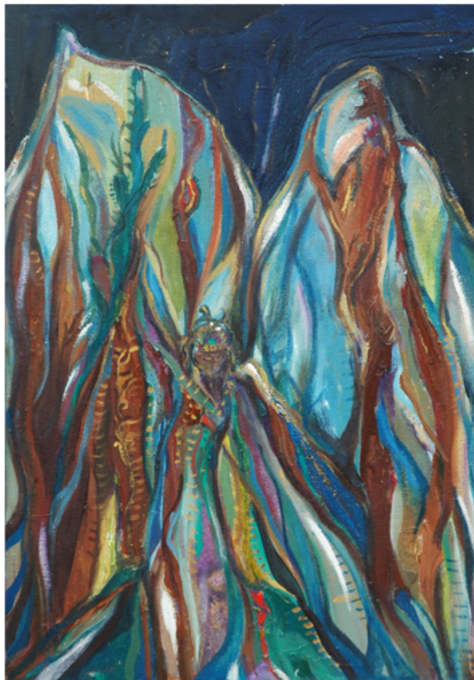
Apu 1 Oleo sobre lienzo 35 x 50 cm